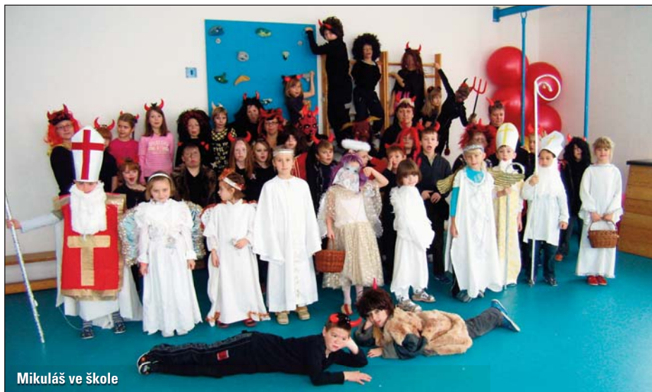
Mikuláš ve škole

Od poloviny listopadu žijeme přípravami na předvánoční vystoupení v Habrovanech i v Olša-