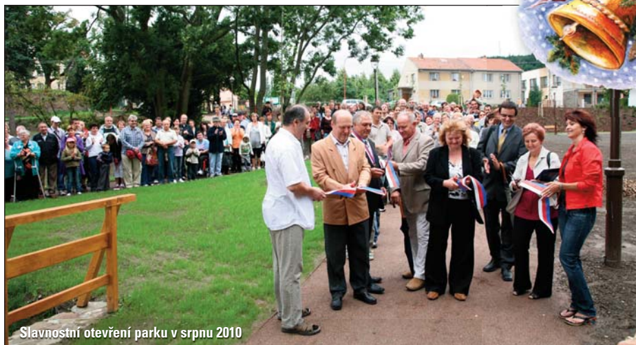
Slavnostní otevření parku v srpnu 2010