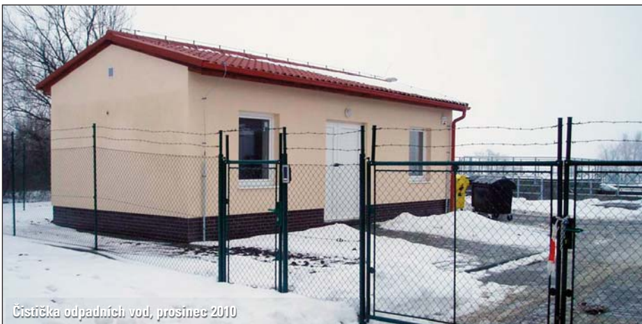
Čistička odpadních vod, prosinec 2010