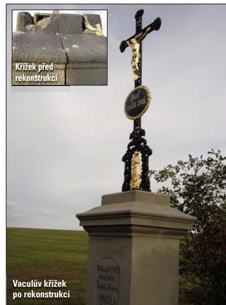
Křížek před rekonstrukcí

V opravách drobných sakrálních staveb, jak jsou křížky, pomníky a „boží muka“ nazývány, pokračujeme proto, že je vybudovali naši předkové a předali nám je jako část historie naší obce. Patří ke koloritu venkova.