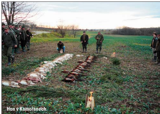
Hon v Komořanech

Poslední letošní hon (Štěpánský) se uskuteční dne 26. 12. 2010, na který večer od 20 hodin naváže Štěpánská taneční, hraje skupina Modul z Těšan. Je připravena bohatá zvěřinová tombola, proto vás co nejrdečněji zveme.