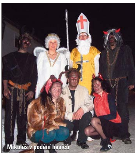
Mikuláš v podání hasičů

Protože se jedná o občanské sdružení, odpovídá tomu i rozsah činnosti. Zášahová jednotka je připravována ke snižování škod vzniklých požáry, ale i přírodními katastrofami a nehodami.