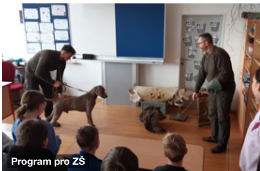
Program pro ZŠ