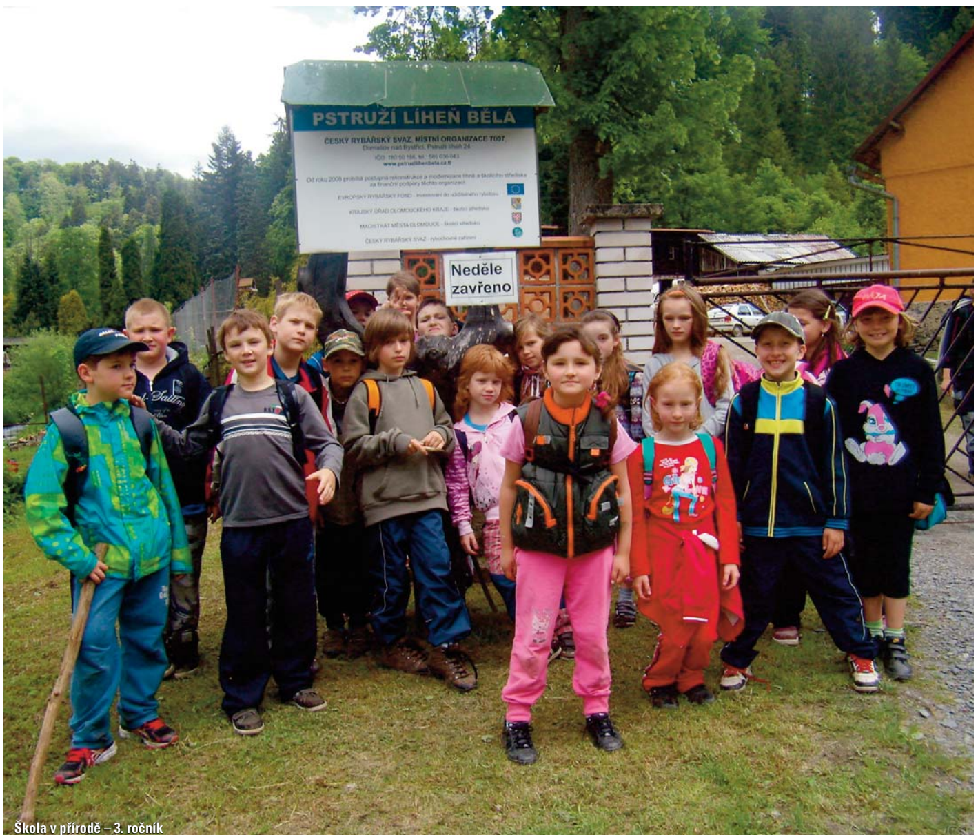
Škola v přírodě – 3. ročník