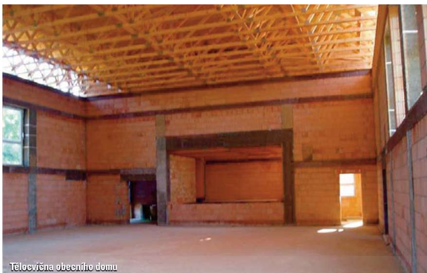
Tělocvična obecního domu

Nejdůležitější a největší akcí v letošním roce je dostavba obecního domu. Jak jistě víte, Pohostinství Pod zrcadlem změnilo majitele, a tím jsme přišli o možnost pořádání kulturních akcí. Pohostinství zatím zůstává, ale ze sálu uvažuje nový majitel zbudovat prodejnu se smíšeným zbožím (Večerku).