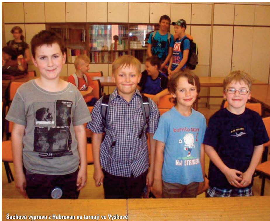
Šachová výprava z Habrovan na turnaji ve Vyškovec

Na konci května odjeli žáci 3.–5. ročníku do školy v přírodě – tentokrát do Domašova nad Bystřicí. Cestovalo se vlakem