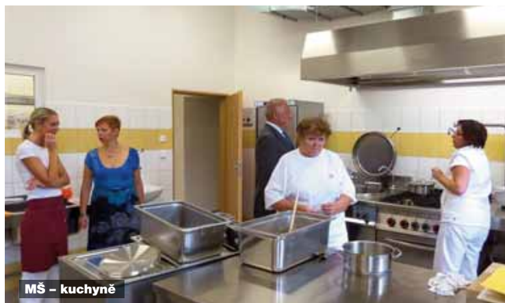
MŠ – kuchyně

Vítání občánků, obecní vepřové hody, dětský maškarní bál, hurá prázdniny, rybí hody s rybářskými závody dětí, rozsvícení vánočního stromu.