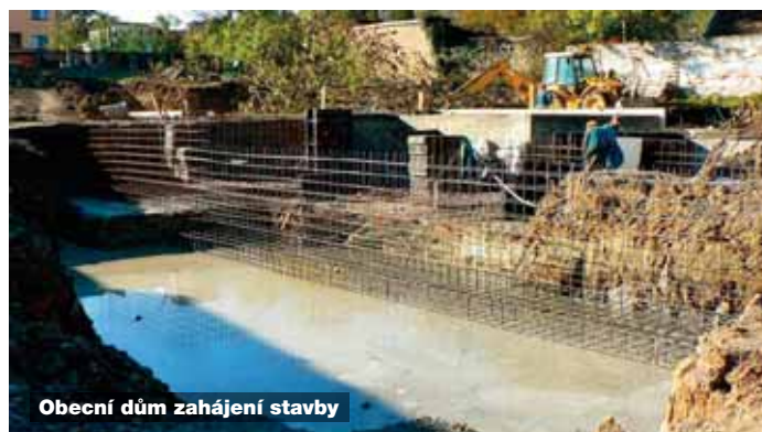
Obecní dům zahájení stavby