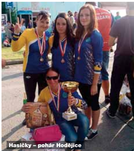
Hasičky - pohár Hodějice

Velká cena okresu Vyškov vypukla již 10. května na návsi v Šaraticích. Do velké ceny zde bylo přihlášeno 20 družstev mužů a 10 družstev žen. V nemalé konkurenci 32 týmů naše dvě mužská družstva obsadila 10. a 11. místo s časy na hranici 20 vteřin. Následovali soutěže v Radslavicích, Topolanech, Hlubočanech, kde se časy pohybovaly na okolo 19 vteřin, střídavě s úspěchy „A a B“ týmů. Děvčata zabodovala v Topolanech s časem 20,90 vteřin a 5. místem. Na dalších soutěžích se spíše nedařilo z důvodu stále chybějících děvčat, která by toto družstvo doplnila, nezbyvalo nic jiného než si půjčit děvčata od ostatních týmů na chybějící pozice. Dne 12. července se uskutečnil již 8. ročník O pohár starosty obce Habrovany. Letošní ročník navštívilo celkem 34 družstev. Mezi záplavami časů kolem