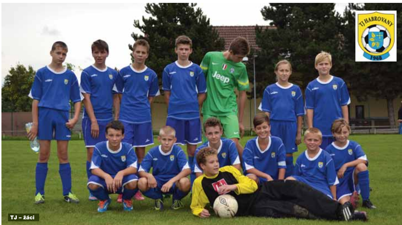
TJ - žáci