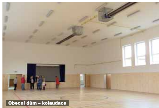
Obecní dům – kolaudace