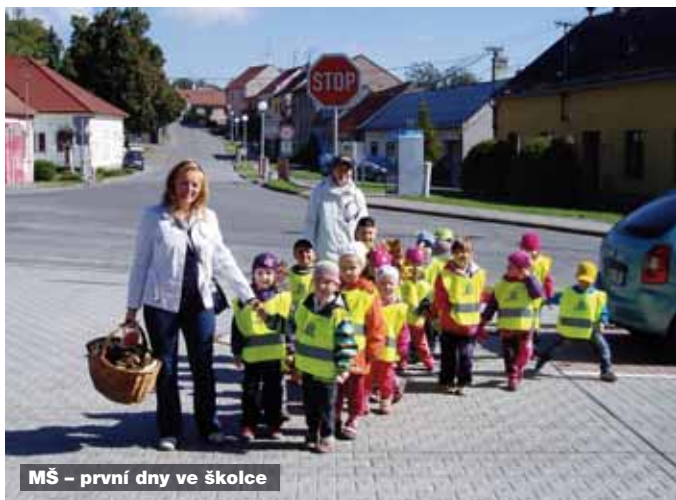
MŠ – první dny ve školce