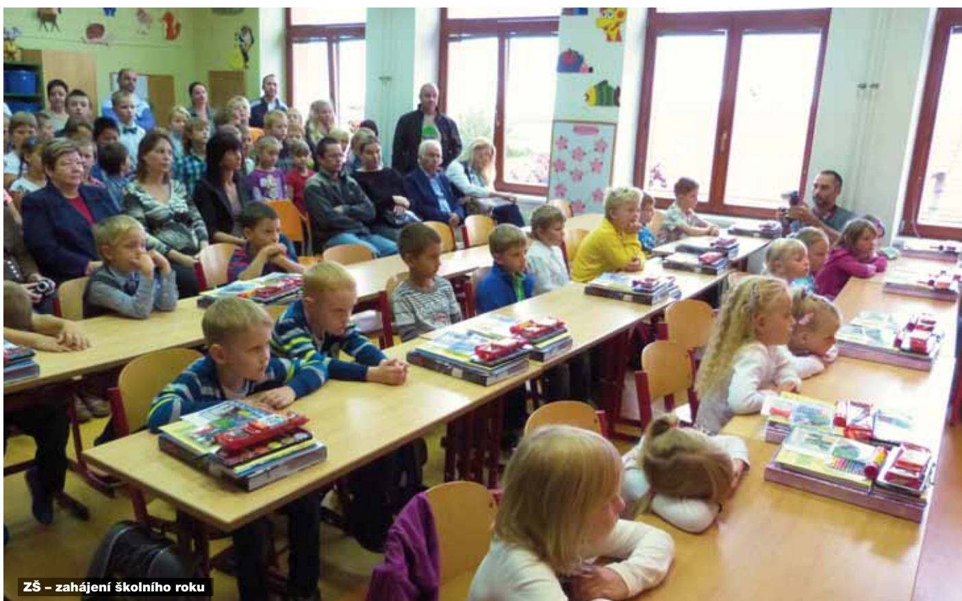
ZŠ – zahájení školního roku