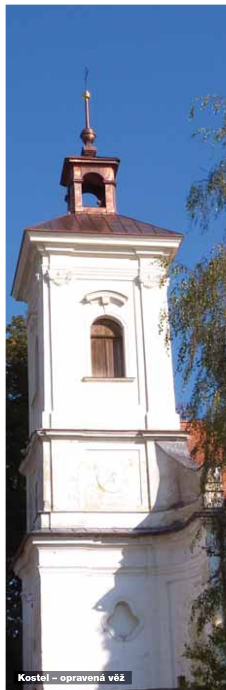
Kostel – opravená věž

Dále v jednotlivých letech proběhly kulturní a společenské akce pořádané obcí ve spolupráci se školou a ostatními složkami.