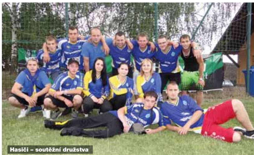
Hasiči - soutěžní družstva