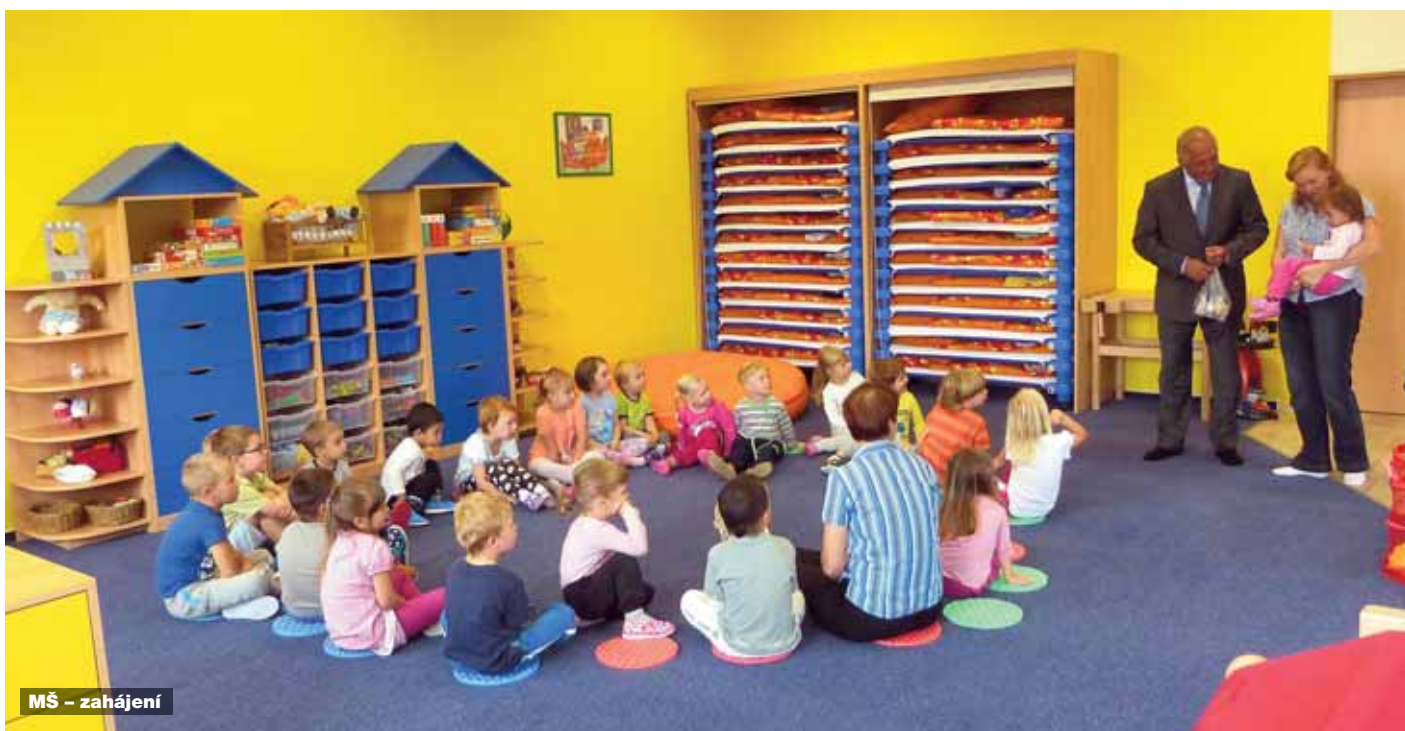
MŠ – zahájení