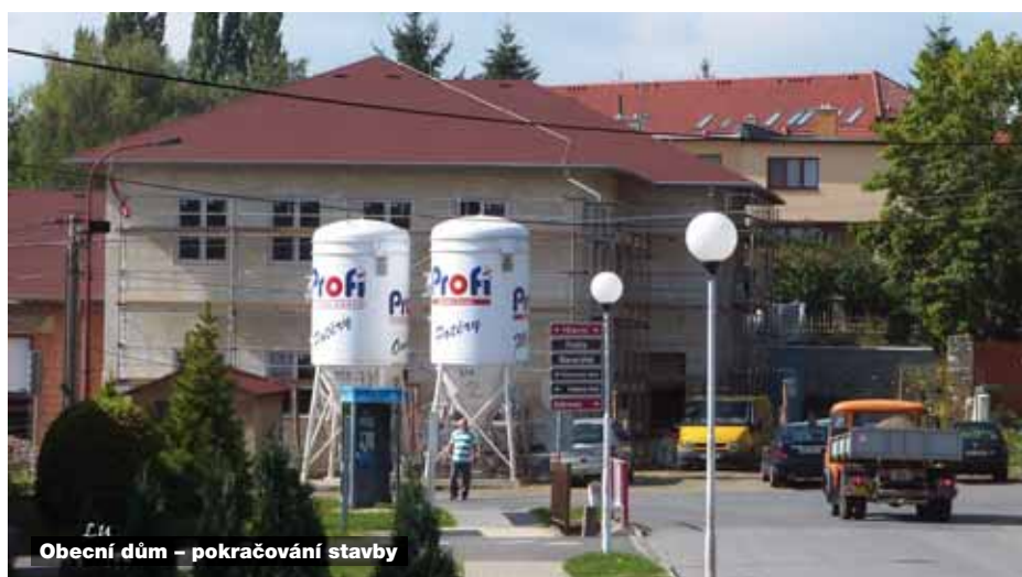
Obecní dům – pokračování stavby