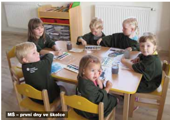
MŠ – první dny ve školce